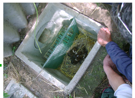
Una bellissima nidiata