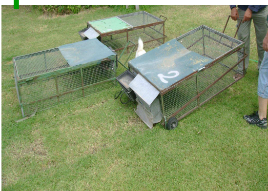
Ingrasso in gabbie mobili su pascolo

Nelle ore calde i conigli si rifugiano prevalentemente nei nidi interrati